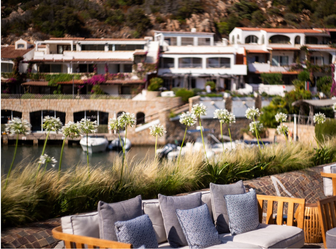
Caffè della Piazza

La stagione di Poltu Quatu prende il via con una nuova energia. A un anno dal rilancio avviato da Castello Sgr, e dopo l'apertura di W Sardinia – Poltu Quatu lo scorso 1° maggio, il borgo continua la propria evoluzione, consolidando un'identità sempre più viva, contemporanea e internazionale.