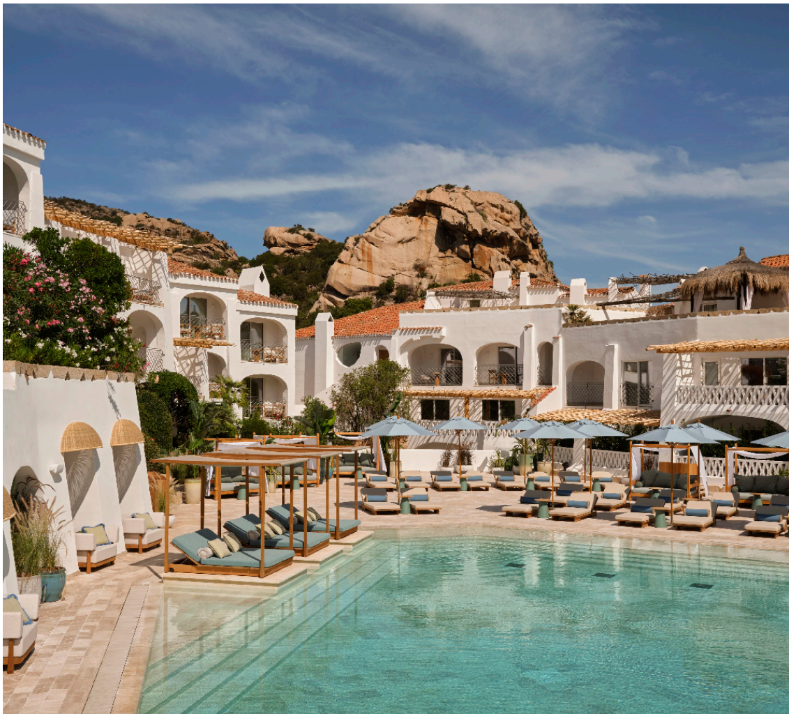
W Sardinia - Poltu Quatu

Per chi preferisce restare a terra, Technogym firma un'ampia area benessere affacciata sul porto, con trainer dedicati e programmi personalizzati. Poco distante, i campi da tennis e padel gestiti da LUX Tennis ospitano lezioni private, programmi di allenamento su misura e clinic di gruppo.